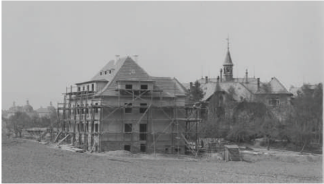
ehemaliges Krankenhaus - heute Magda-Kupfer-Haus