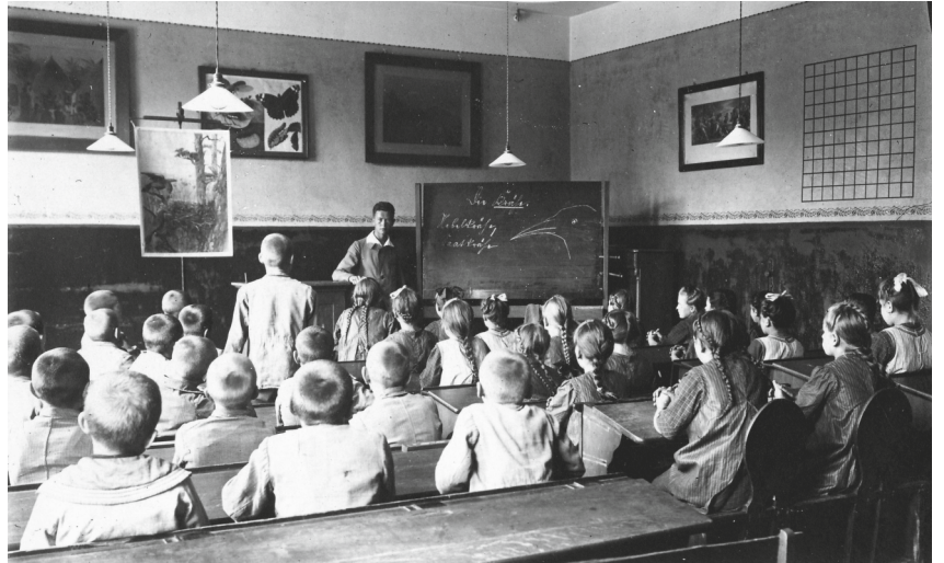
Schulunterricht im neuen Schulgebäude in Moritzburg