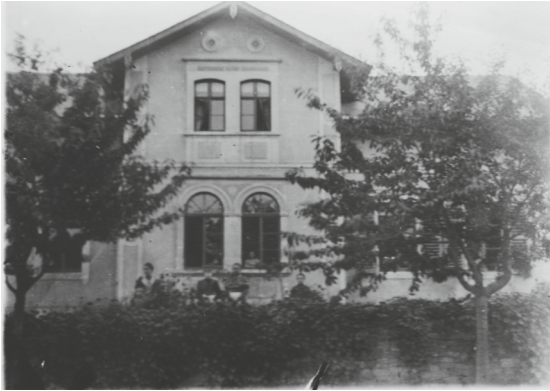
Rückseite der Anstaltskapelle in Obergorbitz

Im Jahr 1894 berichtet man, dass wieder nicht alle Kandidaten für den Dienst tauglich waren. „ Den 9 Eingetretenen standen 5 gegenüber, die hinweggeweht wurden ... “. Trotz allem kann die Anstalt von der Entsendung von Brüdern berichten, deren Qualifikation „begehrt“ wurde. Beim Unterricht möchte man den Kindern im Rettungshaus eine Spezialisierung ermöglichen. Dabei weiß das Rettungshaus, dass nicht nur die reine Wissensvermittlung, sondern auch die Erziehung im Mittelpunkt stehen muss. Denn diese fehlt den geretteten Kindern häufig. Trotz dieser Herausforderung gelingt es der Arbeit des Rettungshauses, das Schulamt zufriedenzustellen.